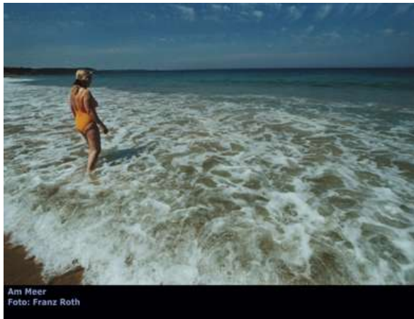
Am Meer