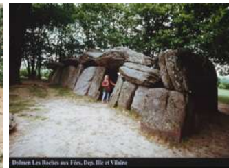
Dolmen Les Roches aux Fées, Dep. Ille et Vilaine © Frauke Ruch Bismarck-Preis Abdruck/Verwendung honorarpflichtig Bismarckpreis erhalten