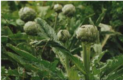
Artischockenfeld; Pays deLéon; Côte d'Armor;