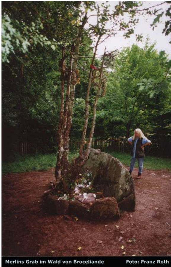
Merlins Grab im Wald von Broceliande