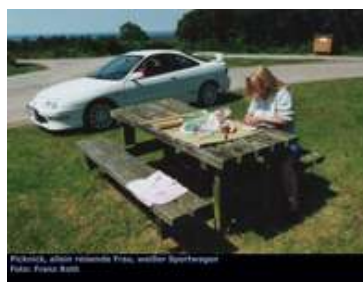
Picknick, neben Renault Trafic, weißer Sportwagen