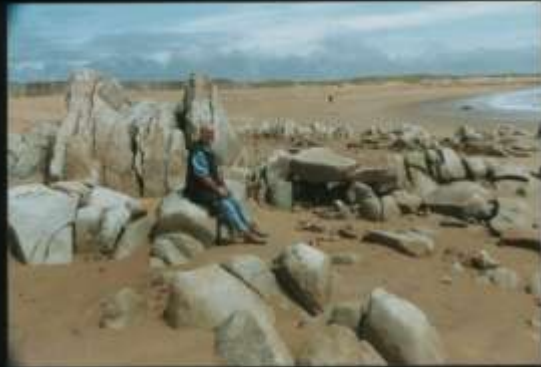
F-Bretagne, Dep. Morbihan; Strand bei Giberon

Abdruck/Vervielfältigung nur gegen Honorar (Belegexemplar erbeten)