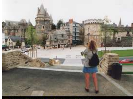
Tourismus, Sightseeing, Vitré, Bretagne, Frankreich