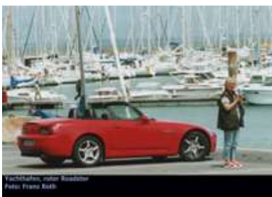
Yachthafen, unter Roadster