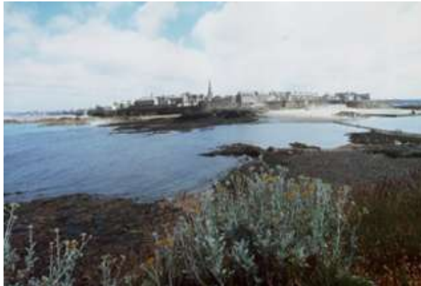
Saint-Malo, l'ancien cité corsaire