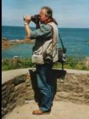
F - Bretagne, Côte d'Armor, Pointe de Châteauneuf

Abdruck/Vervielfältigung nur gegen Honorar (Belegexemplar erbeten)