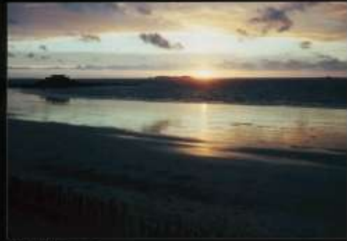
F - Bretagne, Sommevaux, Blick auf Fort National