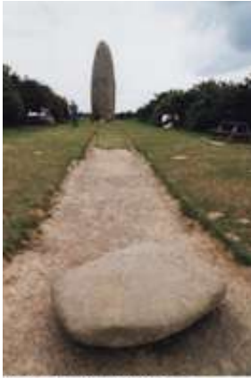
Menhir du Champ Dolent; bei Dol de Bretagne, Département Ille et Vilaine