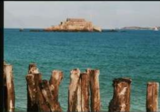
F-Bretagne, Bretagne, Fort National