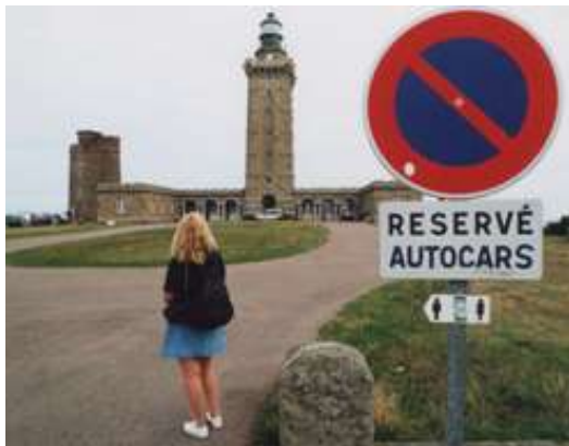
Cap Frehel, Leuchtturm, Bretagne, Frankreich, Department Côte d'Armor