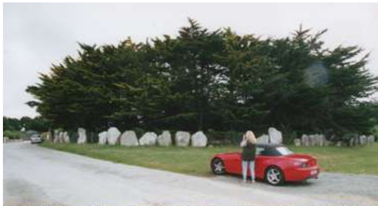
Saint-Pierre-Quiberon; Morbihan; Cromlec'h; Halbkreis von Menhiren