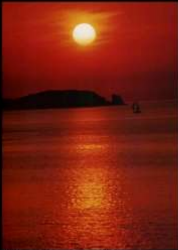
F-Bretagne, Sommevaux, Sonnenuntergang