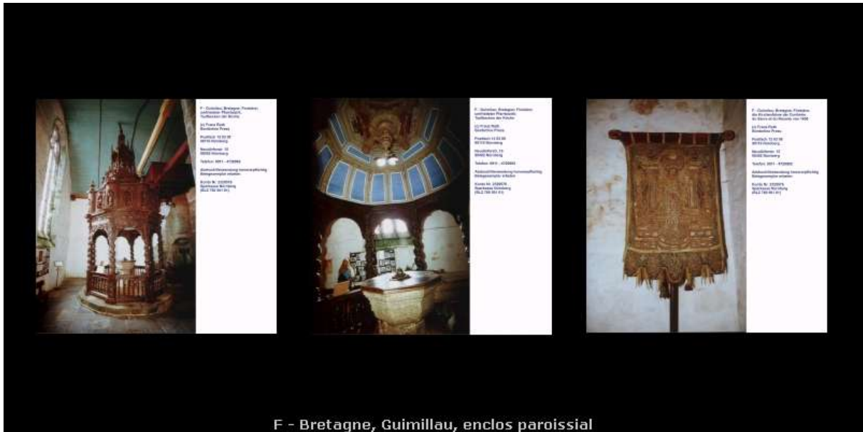
F - Bretagne, Guimillau, enclos paroissial