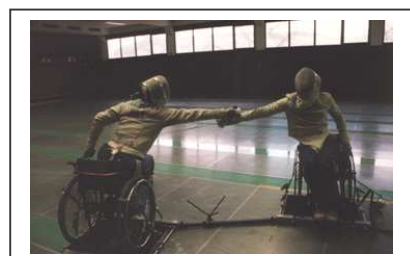
Fotos dieser CD im Format von mindestens 20x30 cm bei 300 dpi Druckauflösung (Farbprofil ICC Adobe 1998)